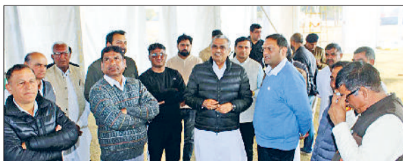
फतेहाबाद। गांव पीलीमंदौरी में राज्य स्तरीय समारोह की तैयारियों का जायजा लेते हुए अधिकारी।

का निरीक्षण कर व्यवस्थाओं का जायजा लिया। निरीक्षण के दौरान उन्होंने मुख्य कार्यवाहक, मंच एवं पंडाल व्यवस्था, अतिथियों एवं आमजन के लिए बैठने की व्यवस्था, पार्किंग स्थल, हेलीपैड,