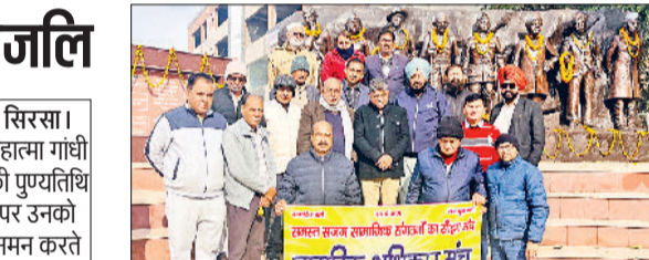
फतेहाबाद। गांधी को नमन करते नागरिक अधिकार मंच के सदस्य।