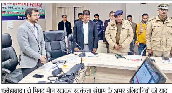
फतेहाबाद। दो मिनट मौन रखकर स्वतंत्रता संग्राम के अमर बलिदानियों को याद करते अधिकारी।