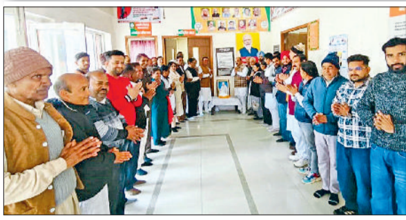
फतेहाबाद। महात्मा गांधी को नमन करते भाजपा।

महात्मा गांधी की पुण्यतिथि पर भाजपा जिला कार्यालय में श्रद्धांजलि कार्यक्रम में किया नमन