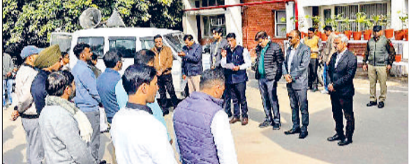
सिरसा। स्वतंत्रता संग्राम के शहीदों को श्रद्धांजलि देते अधिकारी व कर्मचारी।

भारत के स्वतंत्रता संग्राम में अपने प्राणों की आहुति देने वाले अमर शहीदों