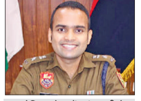
■ भोडिया खेड़ा में पतंगबाजी के दौरान मासूम बच्ची की मौत के बाद एस्पपी ने दी चेतावनी