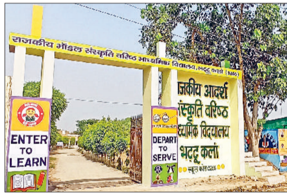
फतेहाबाद। राजकीय स्कूल भट्टकलां।

पत्र में वार्षिक आय 1.80 लाख रुपय या इससे कम है। विभाग ने दाखिले को लेकर शेट्यूल भी जारी किया है। योजना के अंतर्गत छठी से 12वीं कक्षा के बच्चों को प्राइवेट स्कूल में दाखिला दिलाया जाएगा। विभाग ने स्कूलों को 15 फरवरी तक पोर्टल पर कक्षावार सीटों का ब्योरा अपलोड करने के निर्देश दिए हैं। साथ ही नोटिस बोर्ड पर सीटों से संबंधी जानकारी दर्शानी होगी।