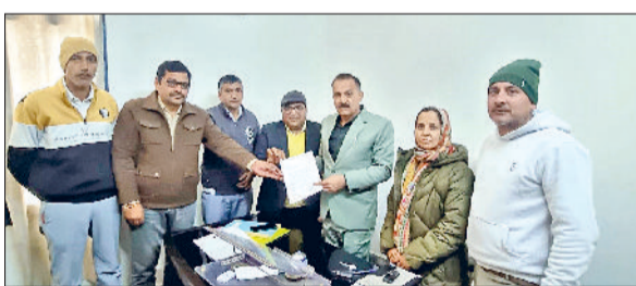
टोहाना। खंड शिक्षा अधिकारी को ज्ञापन देते हुए अध्यापक संघ के पदाधिकारी।