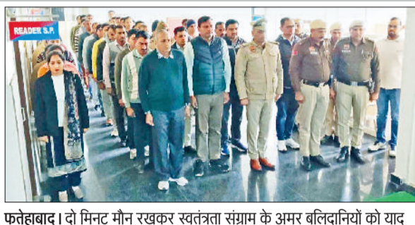
फतेहाबाद। दो मिनट मौन रखकर स्वतंत्रता संग्राम के अमर बलिदानियों को याद करते पुलिस कर्मचारी।