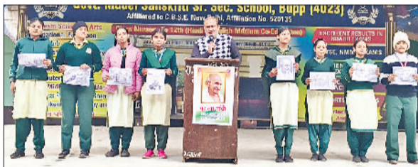
सिरसा। महात्मा गांधी की पुण्यतिथि पर उनको नमन करते हुए।